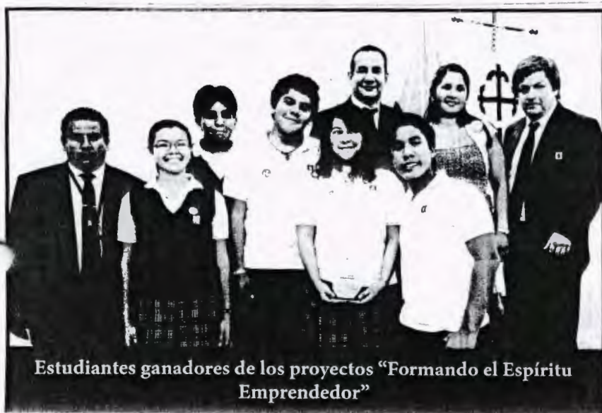
Estudiantes ganadores de los proyectos "Formando el Espíritu Emprendedor"

El curso "Docencia y/o Tutoría para la Investigación", propuesto por la instancia institucional "Vicerrectorado Académico" de la UCSG (Proceso de Investigación de Pregrado) y el CIEDD, desarrolla una visión global, fundamentada y crítica —al mismo tiempo que práctica— del proceso de investigación desde diferentes paradigmas y metodologías, abarcando todas las disciplinas científicas. Se trata de un espacio multidisciplinar de discusión y aprendizaje del sentido, la estructura y las exigencias metodológico-organizativas del proceso general de investigación.